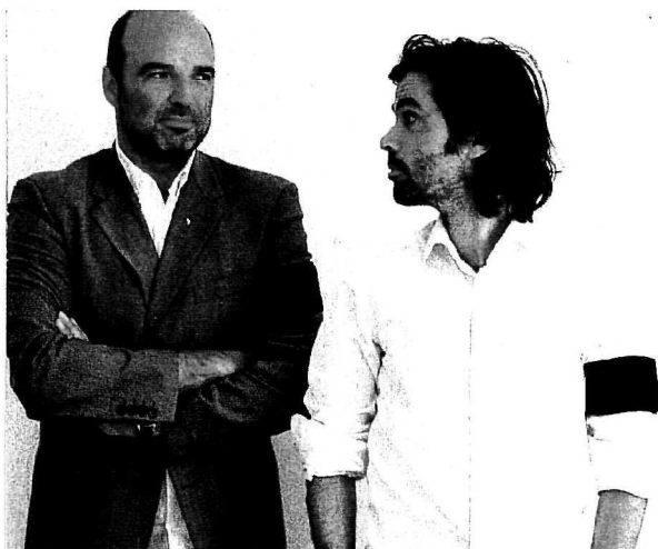
KOBER & HOLCMANN (r.). Mit Ironie (und Trauerflor) aus dem Schneider – S&J Österreich ist eine eigenständige Agentur.